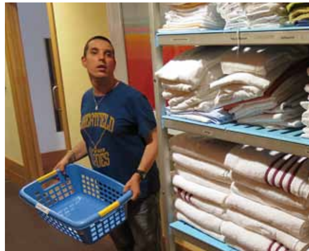
• Udalaitz, Arrasate.

En el caso de Kimu (Goienetxe), se ha celebrado una reunión mensual de participación de las 4 personas residentes en dicha vivienda.