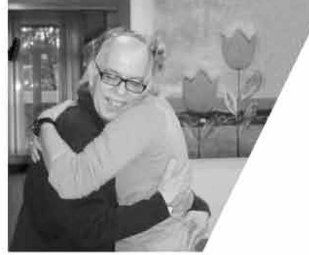
Diseño eta elaborazioa eko.tx Diseño y realización