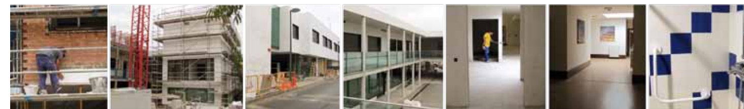
Obren aurrerapenen sekuentzia, 2013an. / Secuencia del avance de las obras en 2013.

CENTRO ARRUPENEA ZENTROA Calle Alberto Larzabal 1- bis 20303 IRUN Eguneko zentroa / Centro de Día Tno. 943 33 68 83 E-mail: centro.arrupenea@aspacegi.org Etxebizitza / Vivienda Tfno. 943 42 05 30 E-mail: vivienda.arrupenea@aspacegi.org