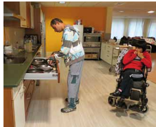
• Goienetxe II.