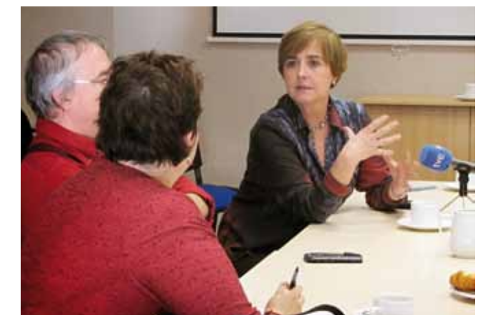
TVE-koek egindako elkarrizketa. / Entrevista con la TVE.