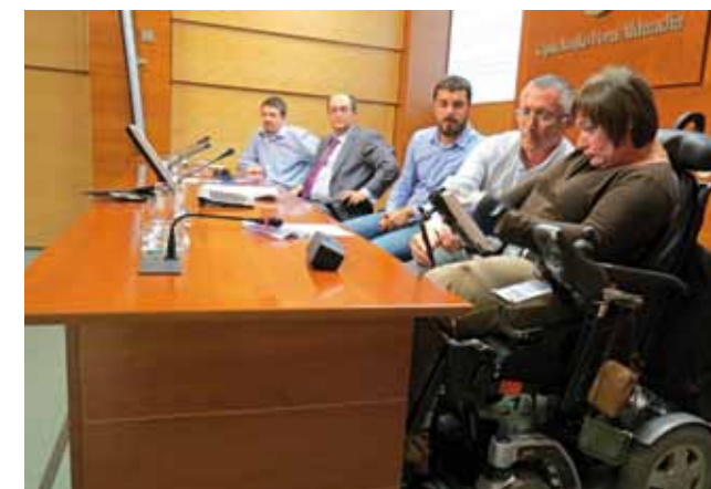
Prentsaurrekoa Gipuzkoako Foru Aldundian. Rueda de prensa en la Diputación Foral de Gipuzkoa.

La crónica se emitió en el espacio informativo Telenorte de TVE, pero además, se emitió reiteradas veces en el canal internacional de TVE, Canal 24h.